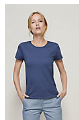
SOL'S CRUSADER WOMEN 03581

*Taille disponible sur certaines couleurs.